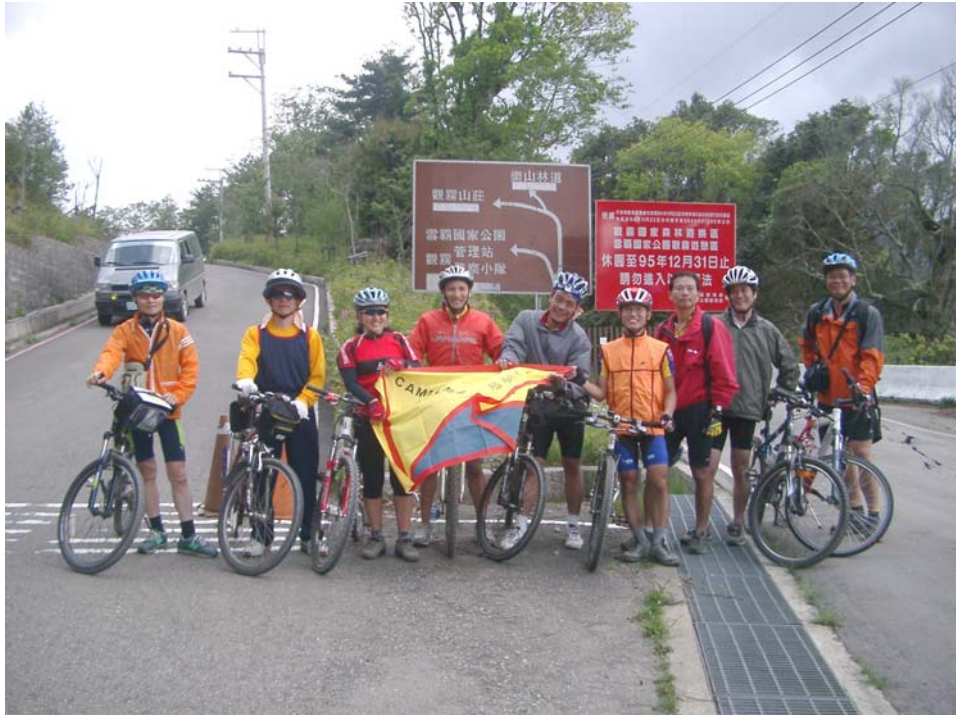
觀霧管理站入口前合影

25K 雪霸國家公園入口界碑處公告禁止進入，不過我們還是進去管理站上洗手間，有員警管制，要我們速離開。已經快 2:00 了，在管理站入口前合影後，往回騎，到雪霸農場小憩喝下午茶，露天座上展望極佳，山谷對面就是霞喀羅古道，陽光燦爛，藍天白雲加天然山景，任山風恣意在臉上吹拂，啊！對每天關在辦公室裡的我們，這是多麼奢侈的享受。