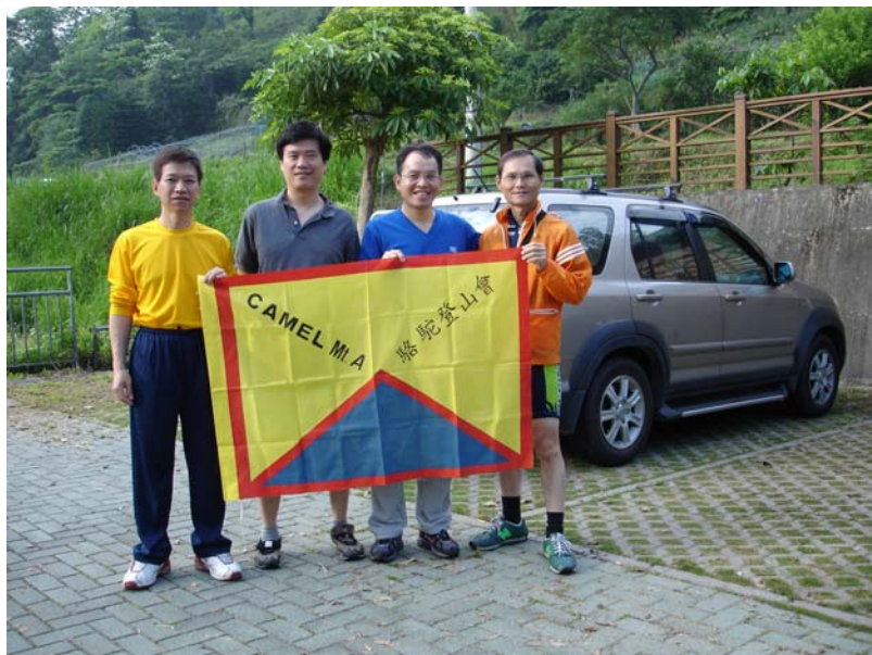
上坪瑞峰國小停車場