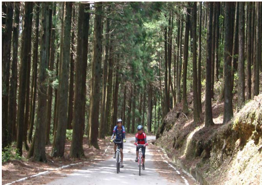
看看多有情調

姐的愛心，一路照顧蔡妹妹。到 20K 雪霸農場岔路前趕上前面的高手，他們已經躺在路邊睡了半小時。約 21K 後林道兩旁都是筆直高大的杉林，樹齡約有 50 年，騎乘其間真是太美了。