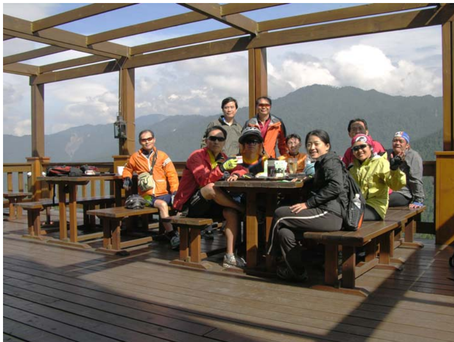
雪霸農場小憩喝下午茶

25K 雪霸國家公園入口界碑處公告禁止進入，不過我們還是進去管理站上洗手間，有員警管制，要我們速離開。已經快 2:00 了，在管理站入口前合影後，往回騎，到雪霸農場小憩喝下午茶，露天座上展望極佳，山谷對面就是霞喀羅古道，陽光燦爛，藍天白雲加天然山景，任山風恣意在臉上吹拂，啊！對每天關在辦公室裡的我們，這是多麼奢侈的享受。