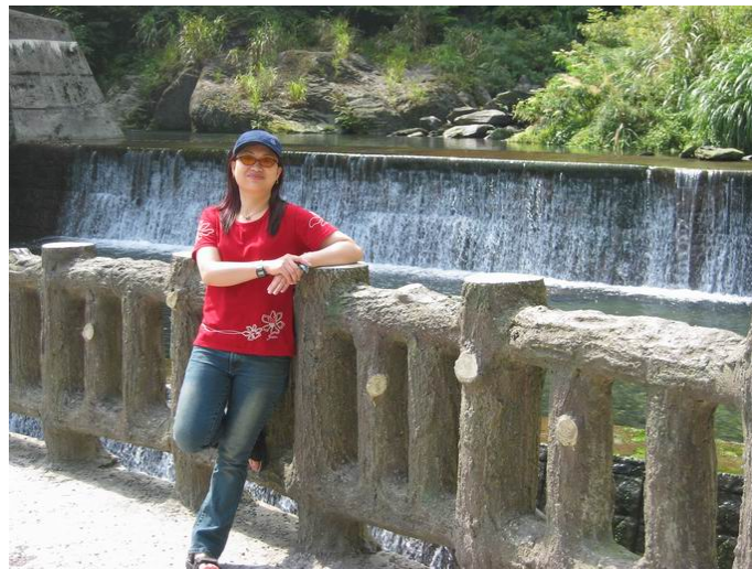
原瀑布前欄杆完好（借用網路上的照片）

土場過後在約 9K 處有一欄砂壩形成的瀑布前休息合影，瀑布前路邊欄杆已被土石流沖走。