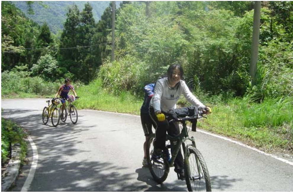
機車男為 226 鐵人賽熱身，騎跑轉換