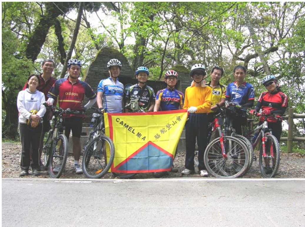
雪霸國家公園入口界碑前合影