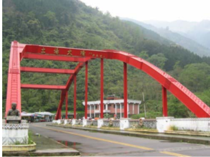
原土場大橋及後面的檢查哨（借用網路上的照片）

由上坪瑞峰國小(標高約 330m)到桃山派出所(標高約 530m),距離約 12.9 公里, 122 線南清 (南寮~清泉) 公路至清泉止,清泉之後即大鹿林道(0K)起點,到土場 (1K,標高約 798m),此處原有一檢查哨,以前入山都在這裡停車辦入山證,順便採買補給,但前年 93/8/25 艾莉颱風超大雨量引發土石流,把二層樓的檢查哨建築、紅色的土場拱橋及旁邊的攤商,全部掩埋沖走,包括三名盡責的員警遭活埋;如今只剩歪斜的橋台,前後照片對照,教人觸目驚心,不得不對大自然的力量心生畏懼。