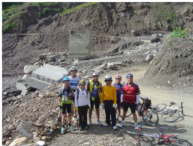
檢查哨不見了,土場大橋如今只剩歪倒的橋台

其實那次颱風風勢不大,大家還高興賺了兩天颱風假(8/24、25 都放假),但颱風為北台灣帶來大量雨水,三重淹大水,石門水庫因大量污泥使桃園、板新地區停水 17 天,自來水公司董事長、總經理因而請辭,行政院長經濟部長坐鎮,供水時間一再延後,新聞焦點都在桃園何時能供水。反而五峰鄉的災情似乎無人重視,至今快兩年,林道仍未修復,可見當時災情之慘重。若不是這次單車活動親臨目睹,老實講我也不會去關心。