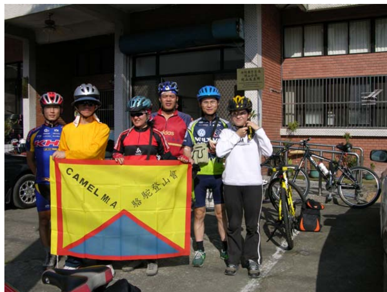
桃山派出所前